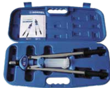
Alle HONSEL -Hebelnietgeräte werden im schlagfesten Kunststoff-Koffer geliefert.