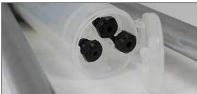
Wechselmundstücke in verschlossenem Fach am Stiftaufangbehälter.